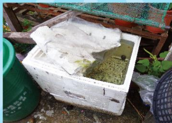
03 保麗龍盒、紙盒、餅乾盒