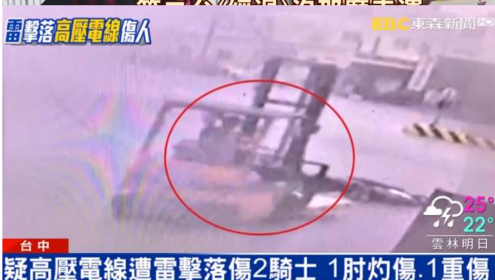
▲一旁的工人本出動堆高機救